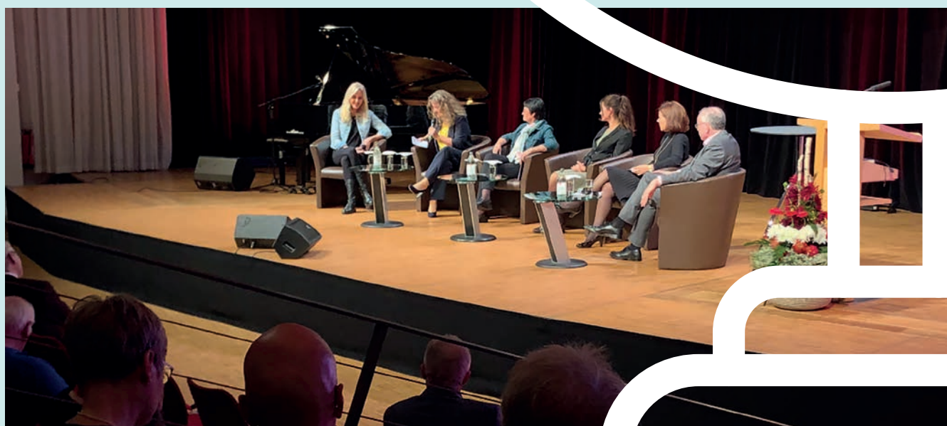
Congrès près de Stuttgart (du 21 au 23/10/2022)

Notre bilan international 2022 compte donc deux rendez-vous importants. Le potentiel d'actions pour l'avenir se construira sur nos relations qui restent étroites avec la Belgique, L'Espagne, les États-Unis, l'Irlande du sud, l'Italie, Les Pays-Bas, la Pologne, le Portugal, la Roumanie, Le Royaume-Uni, la Slovaquie et, plus largement, avec quelque 25 pays qui correspondent régulièrement avec nous.