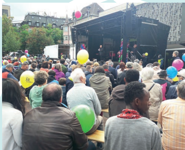
Les "24h pour la vie" à Zurich (17/09/2022)

À Zurich - Oerlikon, le samedi 17 septembre, les "24h pour la vie" ont réuni environ 2 000 personnes et concentré leurs revendications sur l'obtention d'un délai légal de réflexion avant l'IVG. Les défenseurs de la vie allemands ont choisi la même date, le 17 septembre, pour leur marche berlinoise. A l'initiative du Collectif fédéral allemand pour le Droit à la Vie, fort de 20 000 membres et regroupant seize associations, la 18 e édition de la Marche pour la Vie y a rassemblé plus de 4 000 personnes devant la Porte de Brandebourg. Choisir la Vie n'y a pas envoyé de délégation, préférant s'associer à un second événement, quelques semaines plus tard.