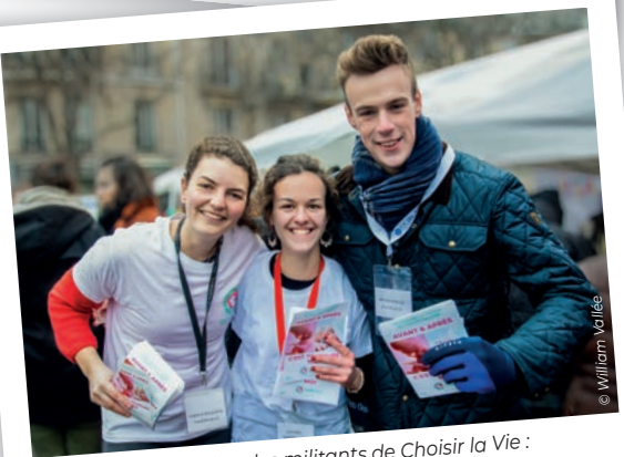
Mobilisation des militants de Choisir la Vie : diffusion de tracts et tenue d'un stand