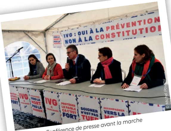
Conférence de presse avant la marche