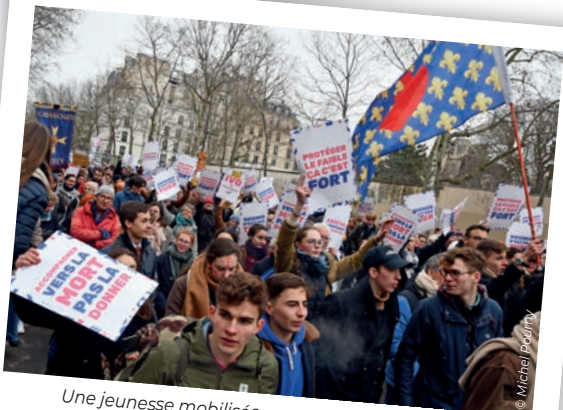
Une jeunesse mobilisée pour la défense de la vie