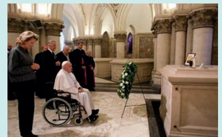
Le Pape, avec le roi Philippe et la reine Mathilde, devant le tombeau de Baudouin dans la crypte royale de l'église Notre-Dame de Laeken

Fin septembre 2024, le juge de l'État de Géorgie a annulé la loi qui interdisait l'avortement au-delà de six semaines, restaurant au passage l'autorisation de le pratiquer jusqu'à la viabilité du fœtus. Le procureur de Géorgie devait faire appel de cette décision.